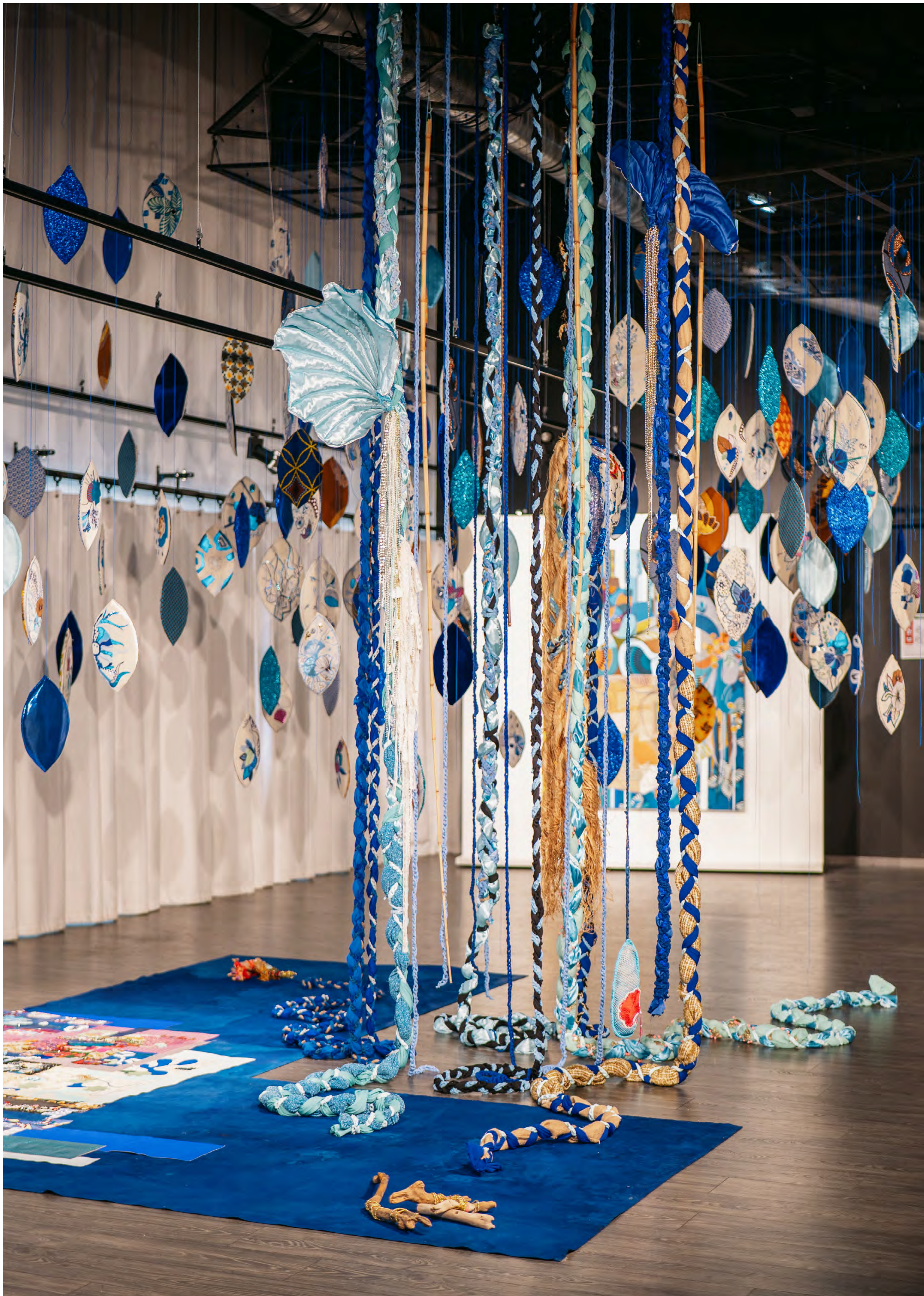
Vue de l'exposition Supplément de Joie à la Fileuse à Loos dans le cadre de la programmation FIESTA lille 3000